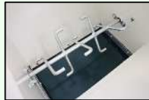
ホッパー内攪拌装置

能力 200~400トレイ/時 適用ポット 高さ 20~160 mm 適用トレイ 幅 280~400 mm