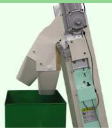
排出口スイング機構