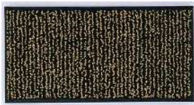
80g (120mℓ) / 箱